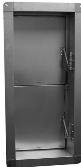
Клапан КИД (90)

Размер проема в ограждающей конструкции тамбур-шлюза определяется проектировщиком в зависимости от производительности и давления вентиляторов дымоудаления и подпора противодымной системы.